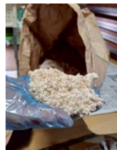
麦を試食、甘みが感じられました