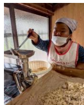
大豆をミンサーに入れる作業が大人気でした

保護者様より 家庭ではなかなかできない体験をさせてもらえてありがたいです。麦や大豆の感触、においなどにふれて、いろんな事を感じてくれたらうれしいです