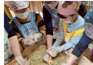
よくもんで丸めて、タルに入れます カビを防ぐために、上に塩を置いています