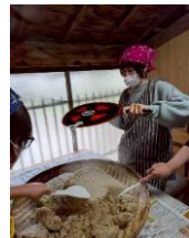
蒸した麦をうちわで冷まします