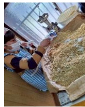
ミンチ状にした大豆と塩を混ぜるます ほぐした麦と大豆をあわせて、もみます!