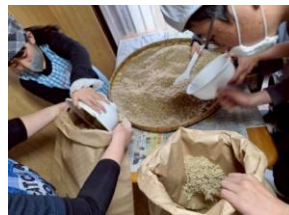
適温になった麦にこうじを混ぜて、コメ袋に入れます