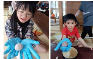
各々自分の分を作りました

現場組合員が、牧園にある組合員所有の山から「けせん」の葉を採ってきてくれて、昔のおやつ、けせん団子作りをしました。けせん団子は、あん団子をけせん(シナモン・ニッキ)の葉で包んで蒸した、鹿児島県の郷土料理です。子どもたちは、けせん団子もけせんの葉を見るのも初めてでしたが、みんなでおいしく食べました。