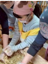
「おいしくなあれ」 食べられるようになるのは2か月後です